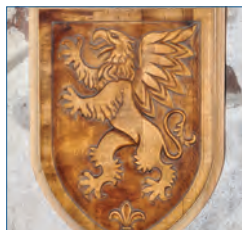
Materialien/Schnitzereien in Sondergrößen