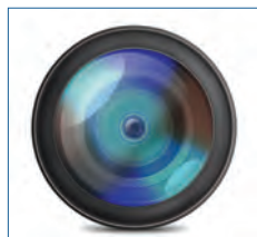
Eine Kamera – ein perfektes Bild – kein Stitching