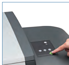
One-Touch-Scan: Das gesamte Bild in nur 4 Sekunden