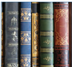
Sonderformate – Bücher