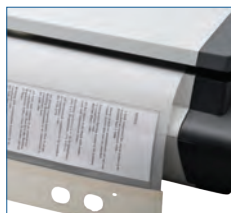
Scannen von übergroßen Dokumenten

Die große Flachbett-Oberfläche bietet höchste Flexibilität und Kreativität : mit den vielseitigen Einsatzmöglichkeiten lassen sich Vorlagen jeder Art und Form scannen.